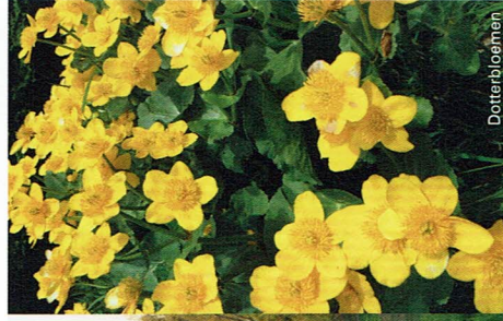
Vallei van de Kleine Herk

Deze landschapswandeling ligt in een cultuurhistorisch beschermd landschap en situeert zich op de grens van droog en vochtig Haspengouw. Het landschap is heuvelachtig. Vanaf de Kolenberg ten noorden van de abdij en vanaf het dorpje Kerniel heb je een schitterend uitzicht op de vallei: een weidelandschap met akkers en hoogstamboomgaarden. Daarboven pronkt de abdij Mariënlof. Midden 20ste eeuw is de abdij bijna volledig omgeven door hoogstamboomgaarden. Door schaalvergroting in de landbouw, de vervanging van hoogstamboomgaarden door laagstamplantages en uitbreiding van de fruitveiling ten zuiden van de oude spoorweg ondergaat het landschap na WOII een metamorfose. Vandaag zie je er voornamelijk akkers, laagstamplantages en weilanden, diepe dalen met ruigten en populieren en hier en daar nog een hoogstamboomgaard.