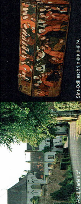
Abdij Mariënlof

Omstreeks 1438 sticht Maria van Colen met de hulp van burggraaf Jan van Gutschoven een klooster van de kruisheren in Kerniel. Door een pauselijke bulle van 1486 wordt de parochie Kerniel bij het klooster Colen geïncorporeerd en door één van de kruisheren bediend. Nog steeds verbindt een mooi kerkpad de kerk van Kerniel met de abdij. In 1822 worden de gebouwen en de landerijen van Colen verkocht aan de laatst overgebleven zuster van de Cisterciënzerinnen-abdij van Woutersbrakel. Om deze historische reden kreeg het klooster Colen sinds 1990 officieel de titel van abdij , aangezien Mariënlof de voortzetting is van de abdij van Woutersbrakel. De abdij heeft nog een mooie ommuurde tuin, die helaas niet voor publiek toegankelijk is.